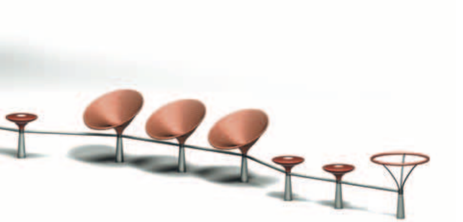
Modulsettet til udearealer lanceres i foråret af Out-sider A/S.