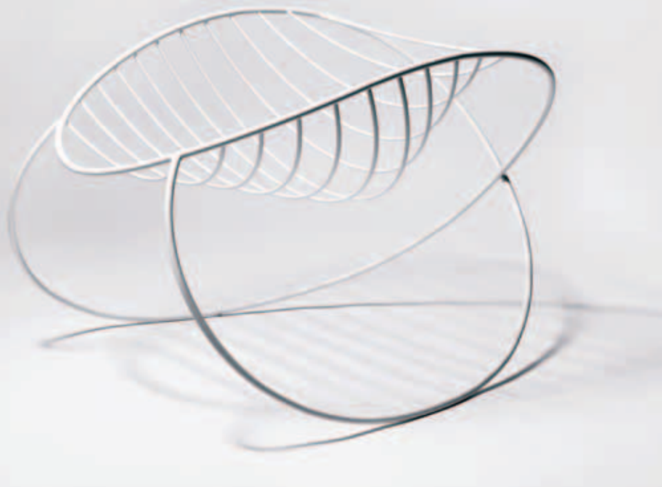
Molecule kommer i løbet af foråret i produktion hos Hay.

»Grundlæggende handler det om at føre nogle kræfter sammen og skabe en synergi. Hvis kemien passer og dialogen holdes i gang, kommer der på et tidspunkt nogle gode produkter ud af det. Så enkelt er det,« mener Århus-designeren. Han understeger, at der i ethvert designer-producentforhold skal være plads til eksperimenter, fordi det som regel er i eksperimenterne, at de store kommercielle succeser fødes.